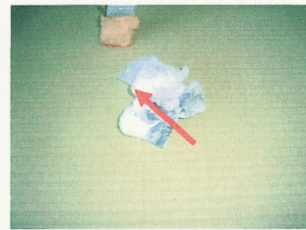
換気扇内側のスス