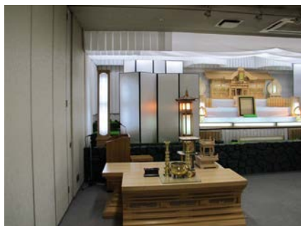
屏風空き部分より祭壇裏を撮影