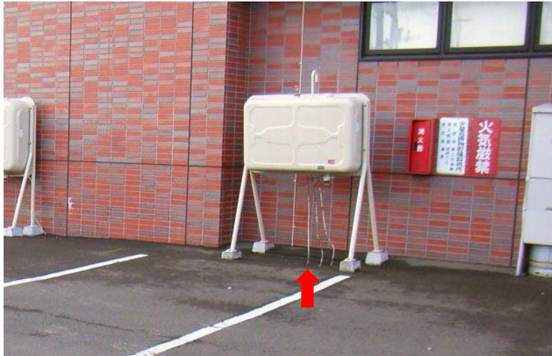
既存ホームタンク

請負契約図面では既存のホームタンクから3本の灯油配管が地中に埋設されFF灯油暖房機に給油配管されている。