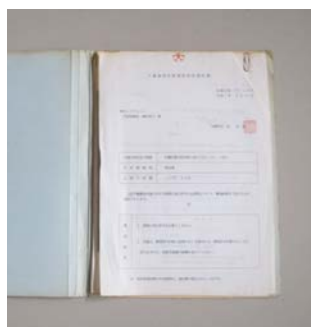
予備審査申請審査結果通知書